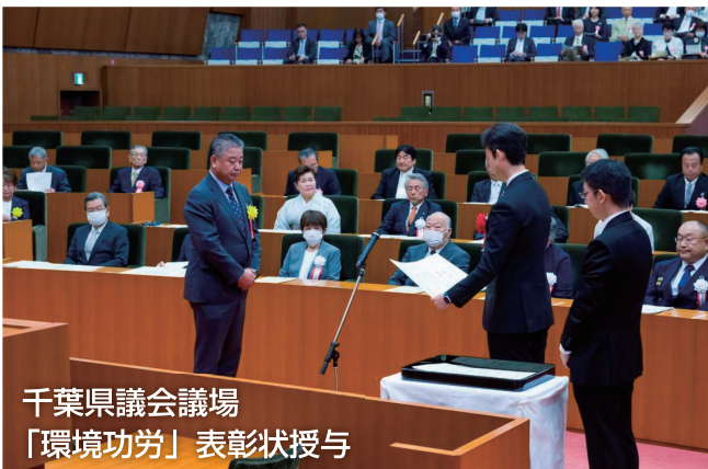
千葉県議会議場 「環境功労」表彰状授与

浄化槽管理者の3つの義務である保守点検・清掃・法定検査を確実に実施するための一括契約制度の推進や効率的な検査方法の普及に尽力し、県民の生活環境保全に寄与している。