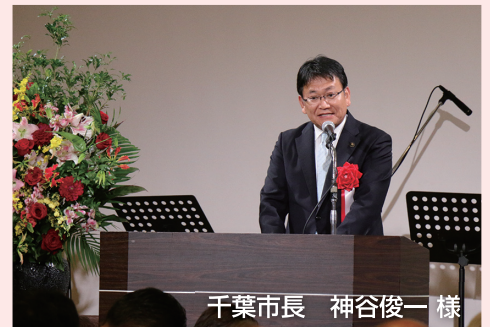
千葉市長 神谷俊一 様