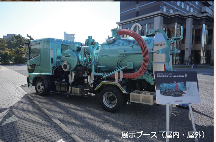
展示ブース(屋内・屋外)