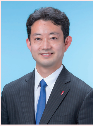
千葉県知事 熊谷 俊人