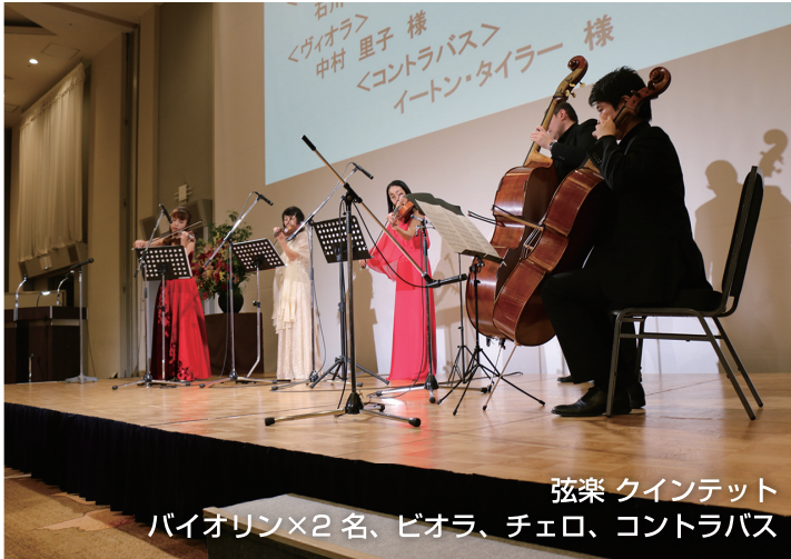
弦楽 クインテット バイオリン×2名、ビオラ、チェロ、コントラバス