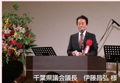
千葉県議会議長 伊藤昌弘 様