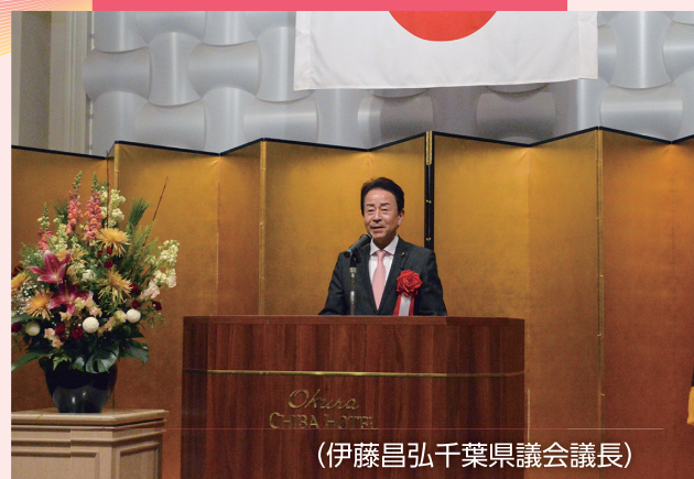
(伊藤昌弘千葉県議会議員)