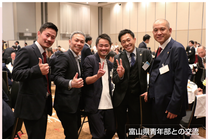
富山県青年部との交流