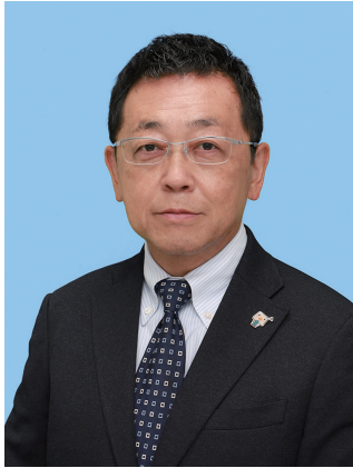
一般社団法人 千葉県環境保全センター

末筆にて恐縮ながら、本年が皆様にとって良い年となりますよう、ご祈念申し上げます。