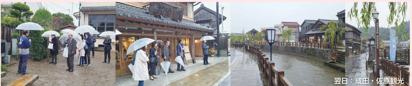
翌日：成田・佐原観光