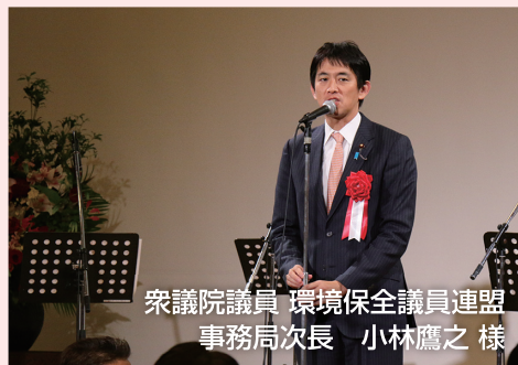
衆議院議員 環境保全議員連盟 事務局次長 小林鷹之 様