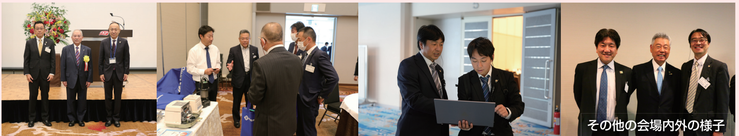
その他の会場内外の様子