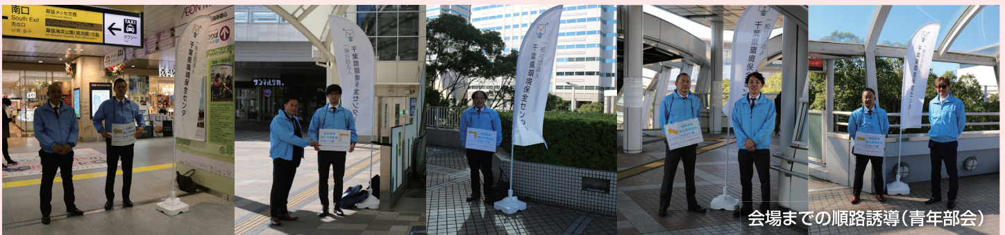
会場までの順路誘導(青年部会)