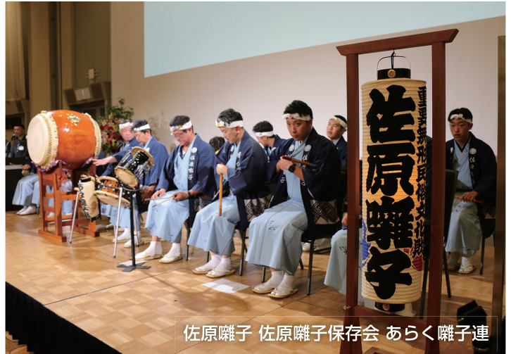
佐原囃子 佐原囃子保存会 あらく囃子連