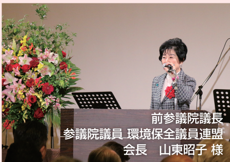
前参議院議長 参議院議員 環境保全議員連盟 会長 山東昭子 様