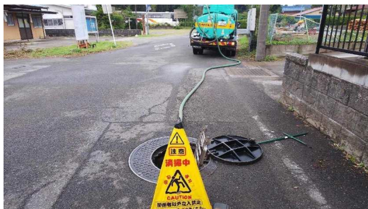
（農業集落排水の輸送の様子）