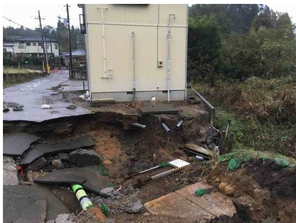
（大雨の影響で崩壊した現場・浄化槽が埋没の様子）

2019年6月の点検時に浄化槽周辺で一部土が流れている状況であったので、担当部局の某市消防総務課に上記を説明し、2019年7月に現地調査を行なったが、補修工事については水路の権利者や消防団器具置場の地権者の同意が必要なことと、当組合では土木工事の許認可を有していなかったことから、他社の土木工事補修をお願いしていた。